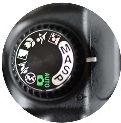
Exemple de bouton des modes de prise de vue

Quatre modes principaux sont proposés : le mode Automatique Programmé (P), le mode Semi-Automatique à Priorité à l'Ouverture (A/Av), le mode Semi-Automatique à Priorité à la Vitesse (S/Tv) et le mode Manuel (M). Les autres modes (Automatique, Portrait, Paysage, Sport, Macro,...) sont des modes automatiques dont les réglages d'ouverture et de vitesse sont programmés de façon à vous donner un résultat plus adapté au type de photo ou de sujet choisi. La bonne nouvelle c'est qu'une fois que vous aurez compris les quatre modes principaux, vous n'aurez plus besoin de ces modes automatiques.