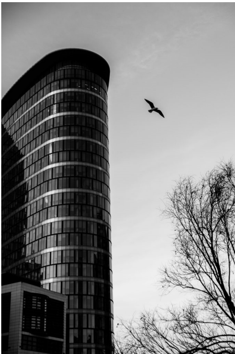
Tour Bruxelles (2019)