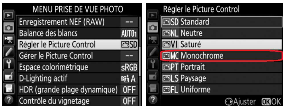
Menu type Nikon à titre d'exemple (votre menu pourrait être un peu différent)

La deuxième chose à faire , est de paramétrer votre appareil pour avoir un traitement noir et blanc directement à la prise de vue. Pour ce faire, quel que soit le modèle de votre appareil, vous devez aller dans le menu et chercher à régler le Style d'image (Canon) ou le Picture Control (Nikon). Pour les autres marques, cela pourrait être quelque peu différent. Fujifilm, par exemple appelle ce réglage " Simulation de Film ".