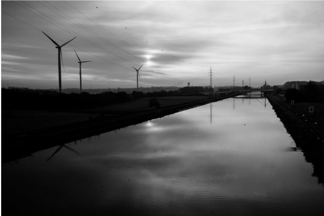
Canal Feluy (2019)