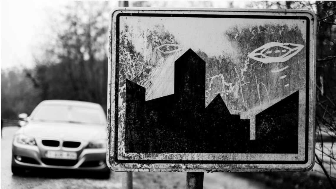
Invasion (2019)