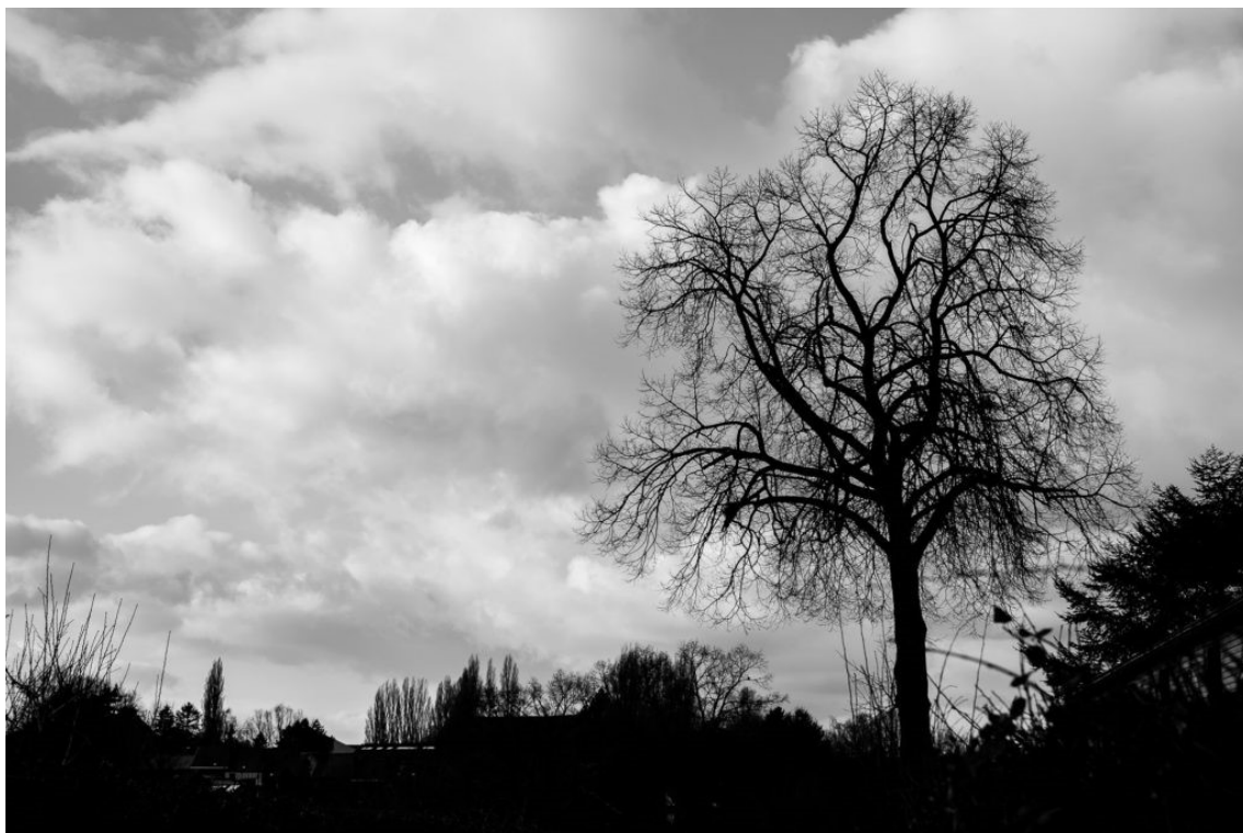
Arbre Noir (2019)