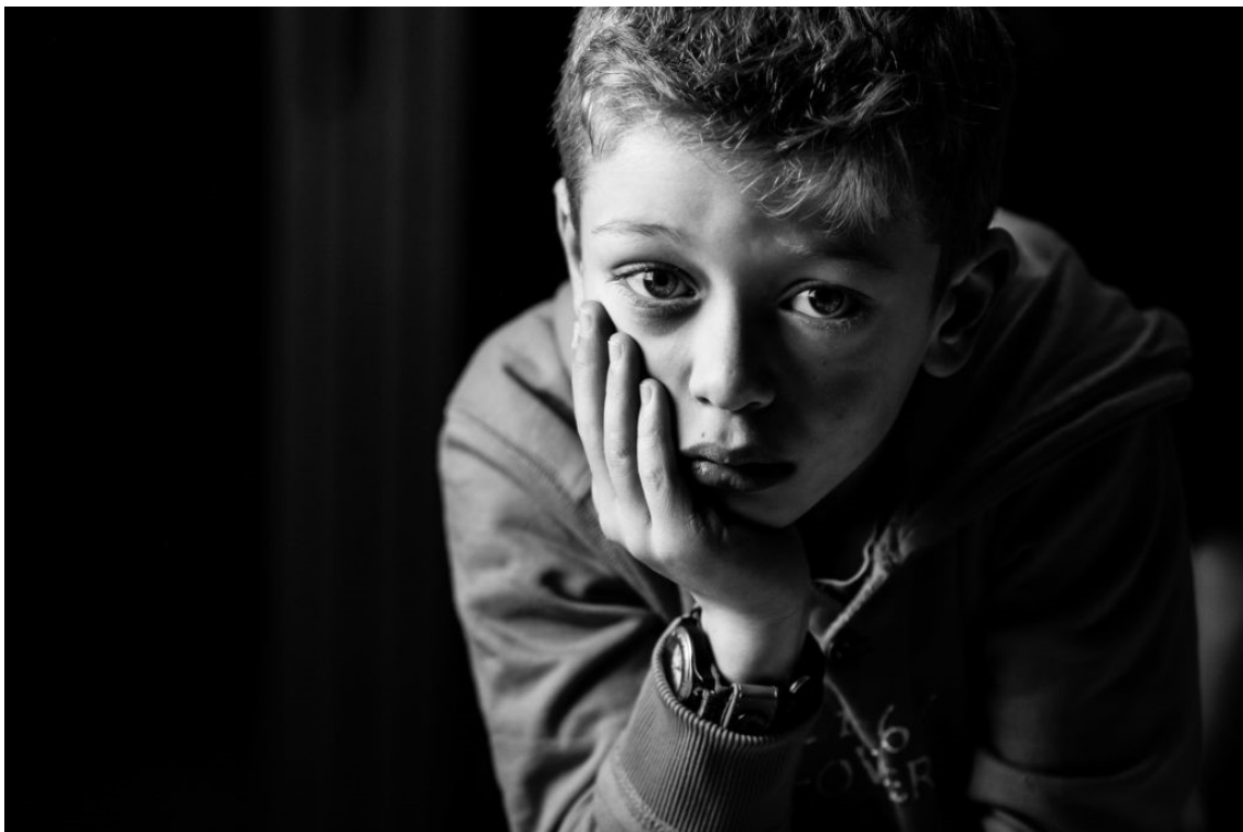
V (2019)