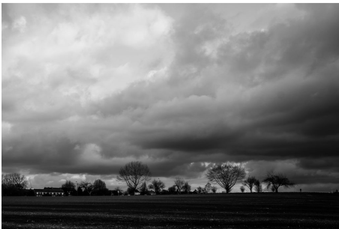
Ciel d'orage sur Ecaussinnes 2 (2019)