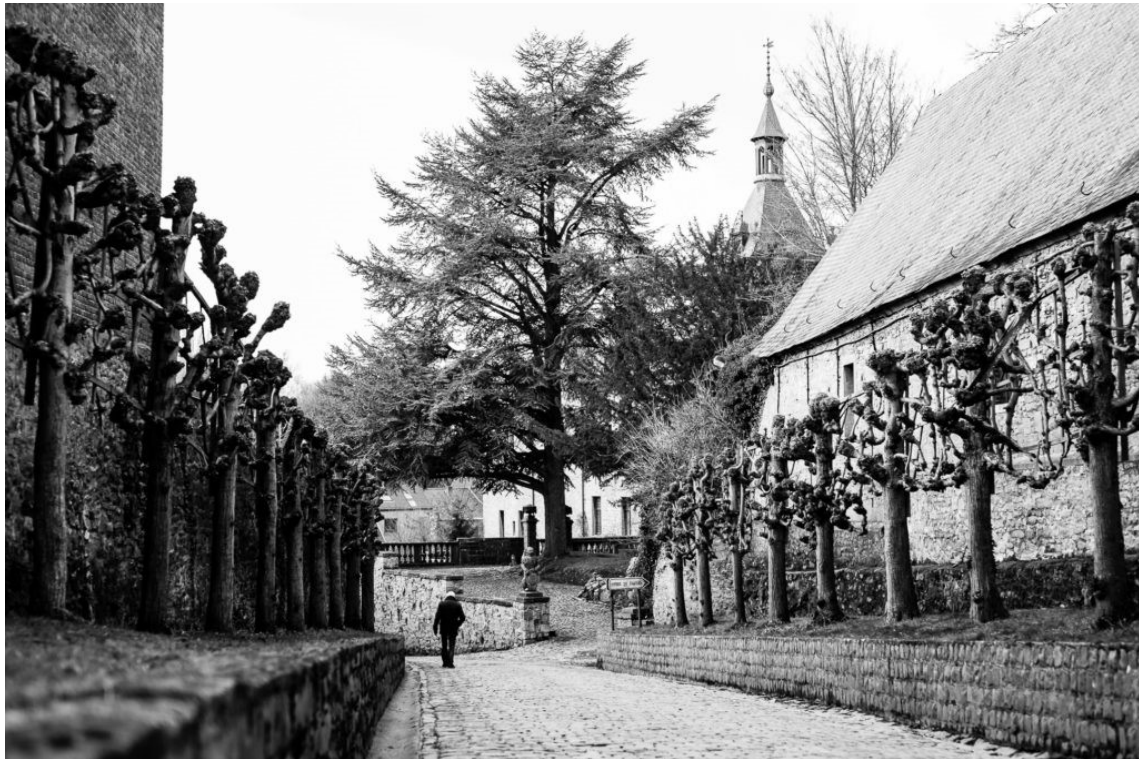
Château d'Ecaussinnes (2019)