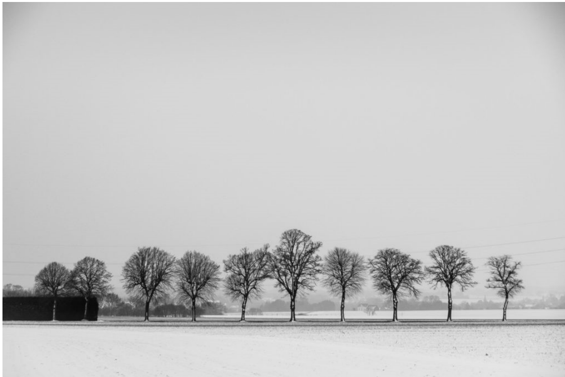
Rangée d'Arbres (2019)

Ce premier défis m'a fait réaliser et j'ai aussi appris :