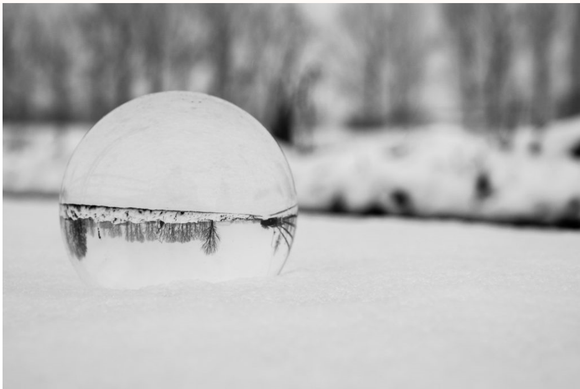
Snowball Lens (2019)