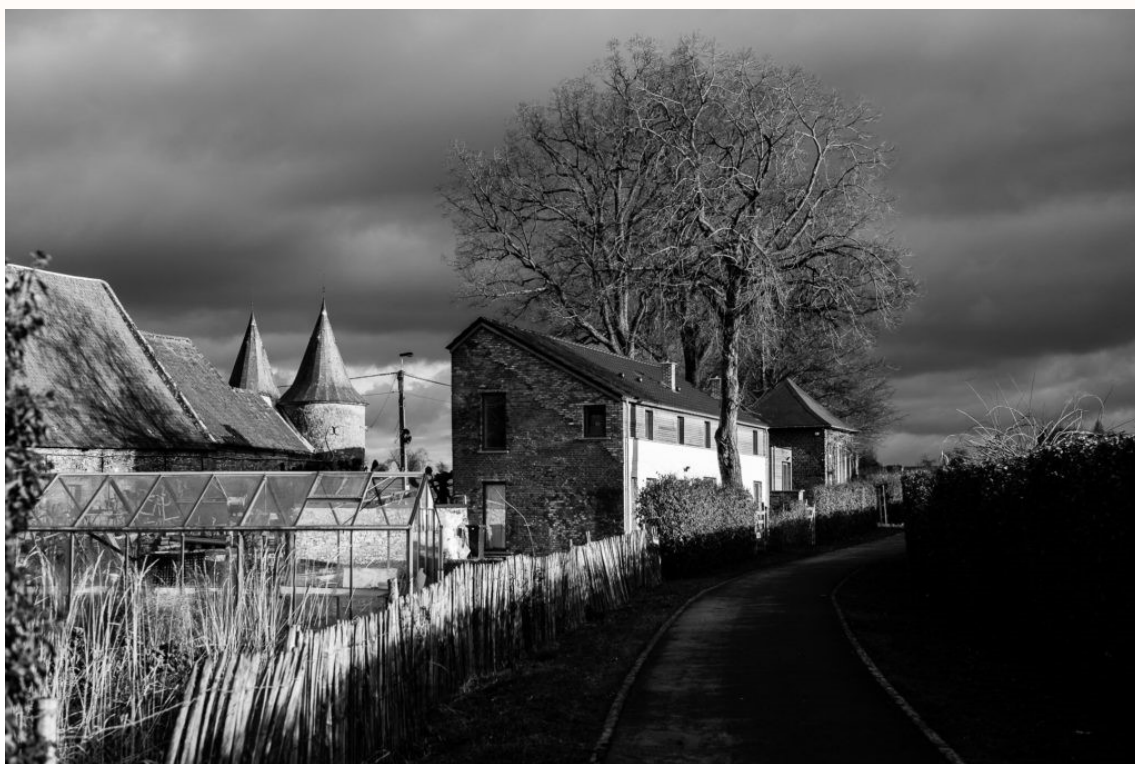
Ciel d'orage sur Ecaussinnes 1 (2019)