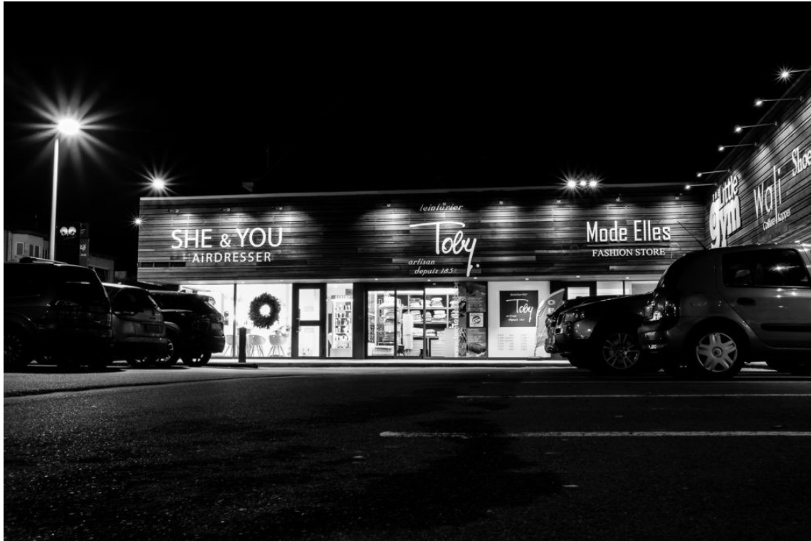
Shopping by Night (2019)

Jusqu'ici mes photos monochromes étaient dérivées de photos couleur que j'imaginai en noir et blanc. Je les post-traitais pour arriver aux résultats que je voulais. Prendre ses photos en noir et blanc développe la vision en noir et blanc et permet de voir ce qui nous entoure avec un œil monochrome. C'est pour moi une aptitude que se travaille et qui s'affine avec le temps et la pratique. J'ai l'impression d'avoir évolué un peu dans ma façon de voir en noir et blanc. Évidemment, ce n'est pas en un mois qu'on peut devenir un photographe expert du N&B mais c'est un bon début, encourageant ! 😊