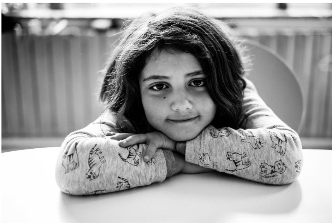
M (2019)

Lorsque l'on débute la photographie et qu'on souhaite réaliser des photos monochromes, ça peut sembler compliqué. Je trouve que la plus grosse difficulté est d'avoir une bonne idée du résultat. Qu'est-ce qui sera bien noir, plutôt gris ou vraiment blanc ? Notre monde et notre vision sont tout en couleur. Il n'est pas très naturel pour nous humains de regarder une scène et de se l'imaginer en un coup d'œil en noir et blanc. Cependant, avec de la pratique, ça devient plus simple. Notre esprit peut nous aider à visualiser les scènes et à anticiper le passage en noir et blanc. Plus vous verrez des photos monochromes, plus vous en ferez vous-mêmes et les visualiserez et plus vous deviendrez capable d'anticiper les résultats.