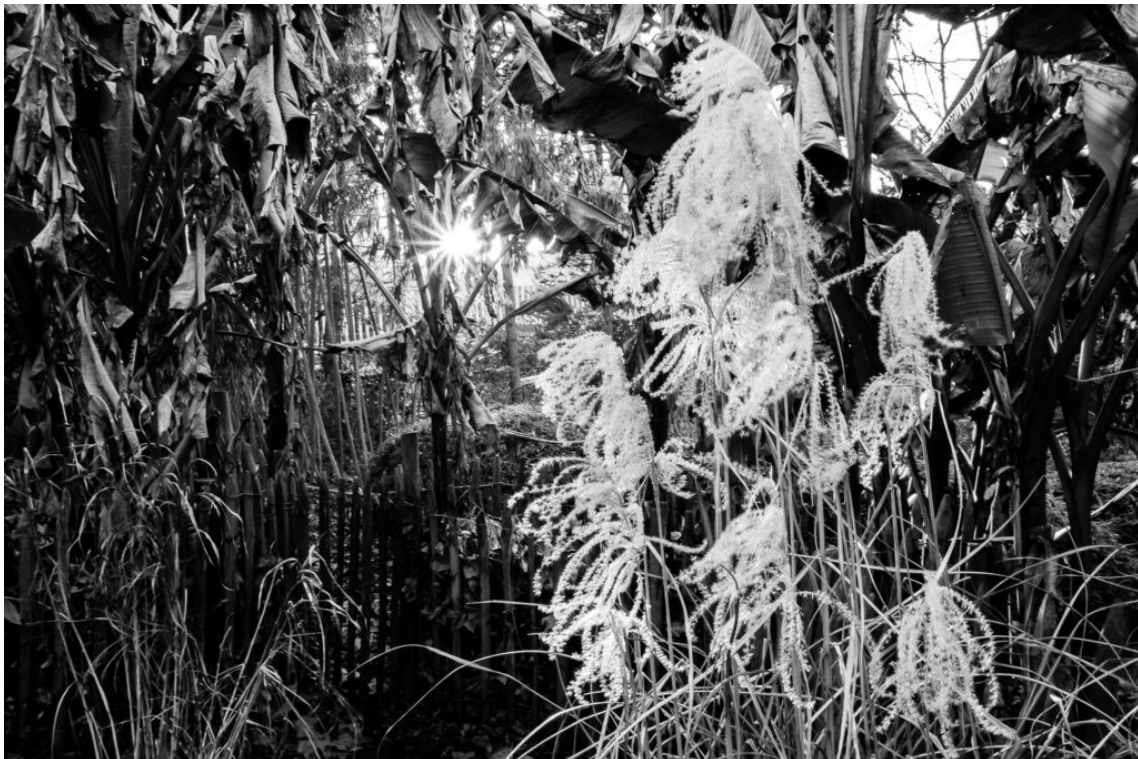
Végétation Urbaine Bruxelles (2019)