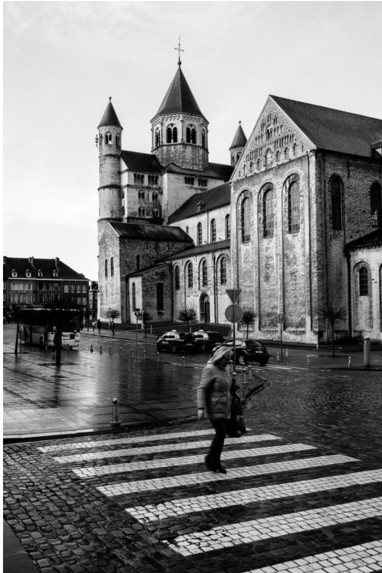
Collégiale de Nivelles 2 (2019)

Voici quelques unes des autres photos de ma sélection liée à cette série en Noir & Blanc