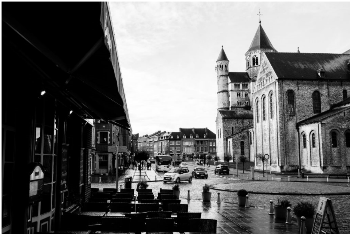
Collégiale de Nivelles 1 (2019)

Lors de cette période d'utilisation du noir et blanc, j'ai remarqué une seconde chose. C'est que pour obtenir des photos intéressantes, le sujet doit bien être mis en évidence. Quand je dis "mis en évidence", je veux dire que la composition et lumière sont primordiales. Si ce n'est pas le cas, le sujet peut facilement se retrouver noyé dans son environnement et l'image perd alors tout son intérêt. La façon de voir et de réaliser des photos en N&B est à mon sens tout à fait différente de ce qu'on fait en couleur. Trop de texture ou d'éléments dans l'image peuvent rapidement constituer un trop plein d'information. Ce qui amènera le lecteur à se perdre dans l'image.