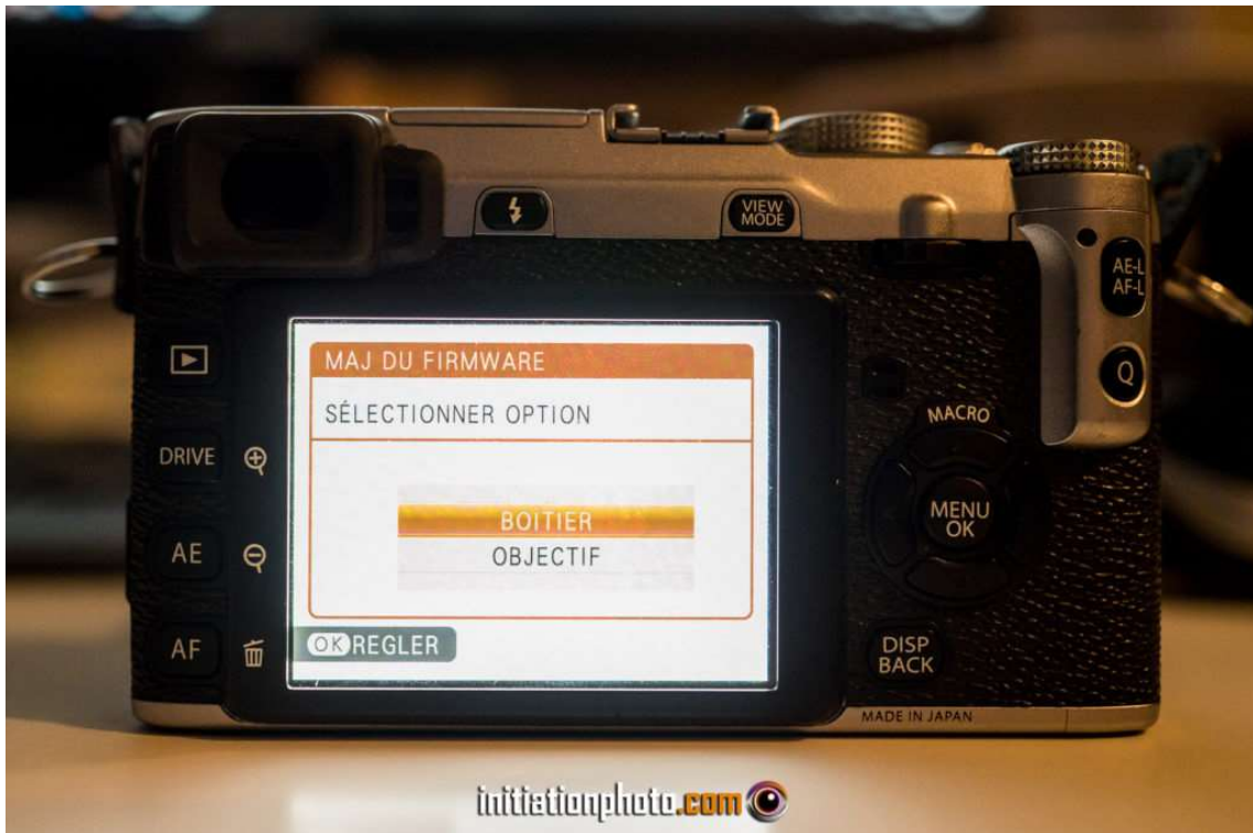
Choix du boîtier ou de l'objectif pour la mise à jour à lancer

Une fois la carte préparée installée dans votre appareil photo, vérifiez que la batterie est bien chargée et allumez l'appareil en maintenant la touche "DISP/BACK" enfoncée. Dans le menu MAJ DU FIRMWARE, poussez sur la touche "OK" pour entrer dans le menu de mise à jour. Là, l'appareil vous propose de choisir entre le boîtier et l'objectif. Faites le choix du boîtier dans un premier temps et appuyez une nouvelle fois sur "OK" pour lancer l'installation du nouveau Firmware.