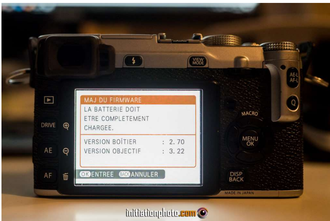
La page principale du menu de mise à jour indique la version du Firmware installé

La première chose à faire est de vérifier votre configuration software actuelle. Pour vérifier la configuration du software de votre appareil Fuji, il faut allumer l'appareil avec le bouton "ON/OFF" tout en tenant le bouton "DISP/BACK" enfoncé simultanément. L'écran qui apparaît vous donne directement la version software de l'appareil. Mais également celle de l'objectif installé, s'il y en a un. Contrairement aux autres marques où il faut entrer et chercher dans les menus, chez Fuji, une petite manipulation au démarrage et vous y êtes. Évidemment, il faut connaître cette opération sinon vous ne saurez jamais quel est le software installé.