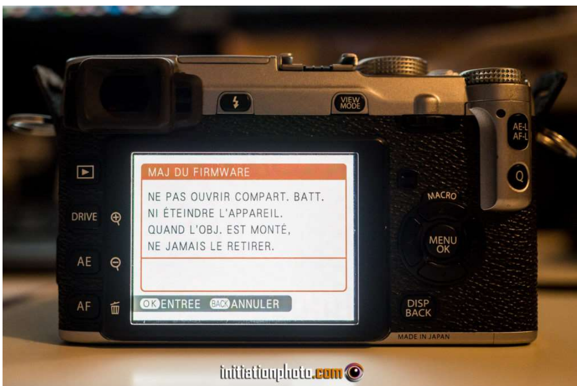
Dernière recommandation avant le lancement de la mise à jour