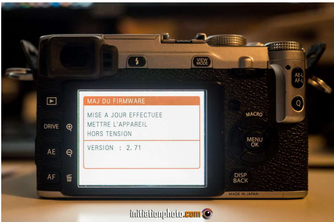
Confirmation de la fin d'installation, indiquant la version du Firmware installée