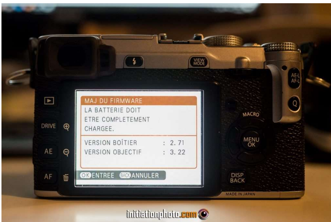
Vue de la page de configuration des Firmwares installés

Pour terminer cette petite procédure, renouvelez l'affichage de la page de mise à jour du firmware pour vérifier que vous avez bien la version souhaitée. Pour cela, maintenez le bouton DISP/BACK appuyé et allumez simultanément l'appareil avec le bouton ON/OFF. Dans le bas de l'écran vous aurez la version du Firmware boîtier et celle de l'objectif. Celle du boîtier devrait avoir changé. Notez que si vous souhaitez mettre à jour le software de votre objectif , vous pouvez procéder de la même manière si ce n'est que vous devez choisir OBJECTIF au moment de faire l'installation.