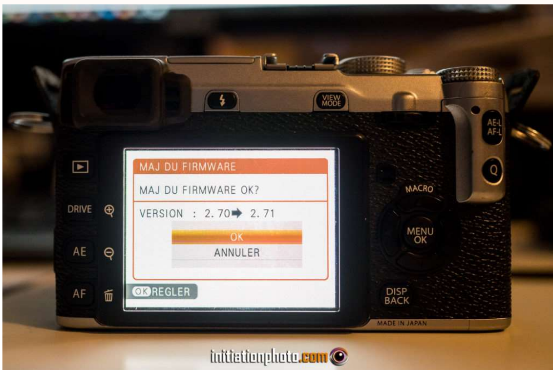
Ce menu indique les deux versions du firmware, l'ancienne et la nouvelle.