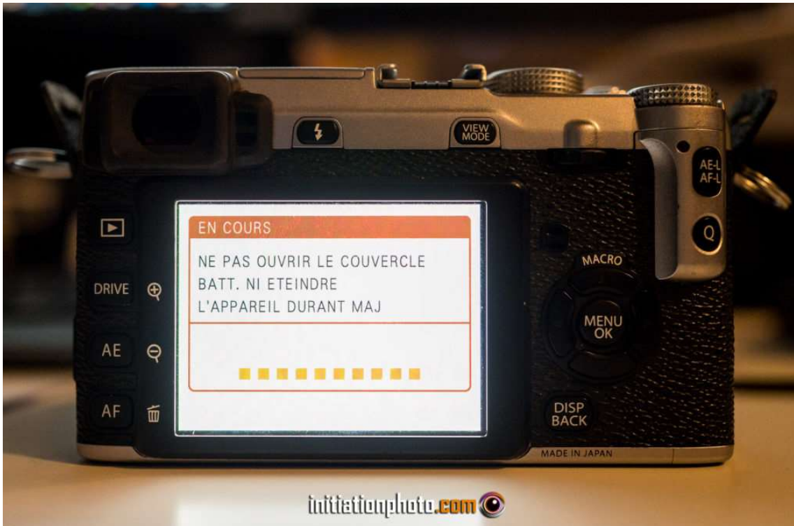
Pendant la période d'installation de la mise à jour, veillez à ne pas éteindre votre appareil