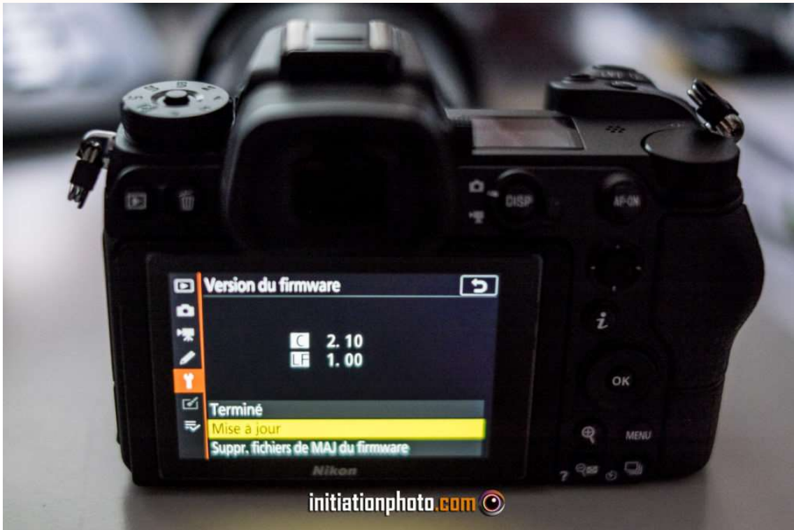
Affichage de la version du Firmware dans le menu Nikon