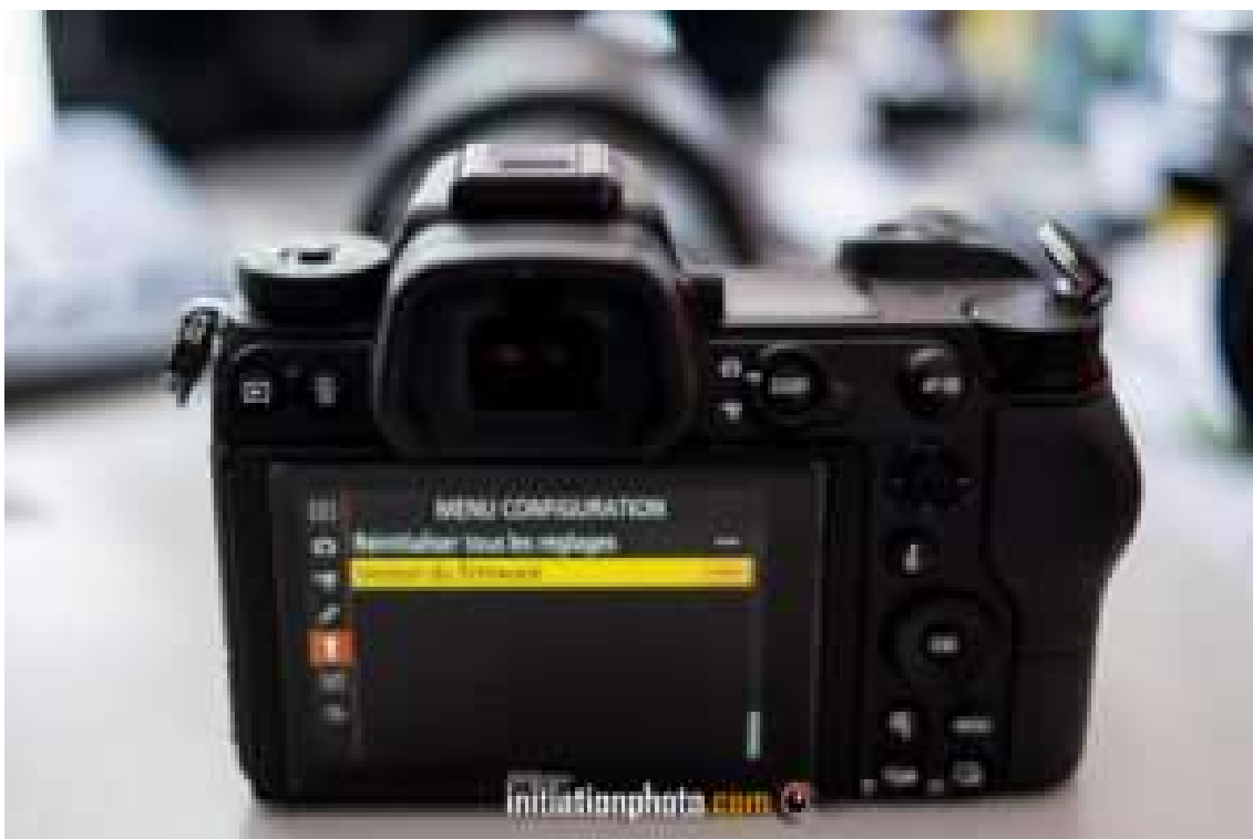
Accès au menu configuration des appareils photo Nikon

La première chose à faire est de vérifier votre configuration software actuelle. Chez Nikon, pour vérifier la configuration software de l'appareil, il faut aller dans le menu principal. Là, rendez-vous dans le menu configuration qui est représenté par une clé anglaise. Sélectionner la ligne "Version du Firmware" pour afficher les softwares installés dans votre appareil.