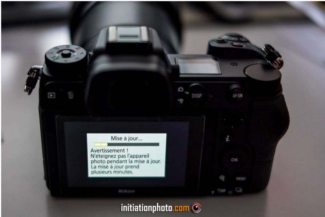
La barre de progression de la mise à jour sur le Nikon Z6